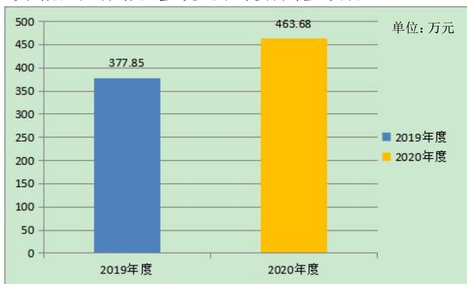
图 1：收、支决算总计变动情况图

2020 年度收、支总计 463.68 万元。与 2019 年度相比，收、支总计各增加 85.83 万元，增长 22.7%。主要变动原因是人员增加和新增食堂改造和设备购置项目。