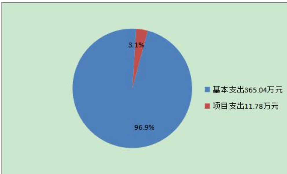
图 3：支出决算结构图

2020 年度支出合计 376.82 万元，其中：基本支出 365.04 万元，占 96.9%；项目支出 11.78 万元，占 3.1%；上缴上级支出 0 万元，占 0%；经营支出 0 万元，占 0%；对附属单位补助支出 0 万元，占 0%。