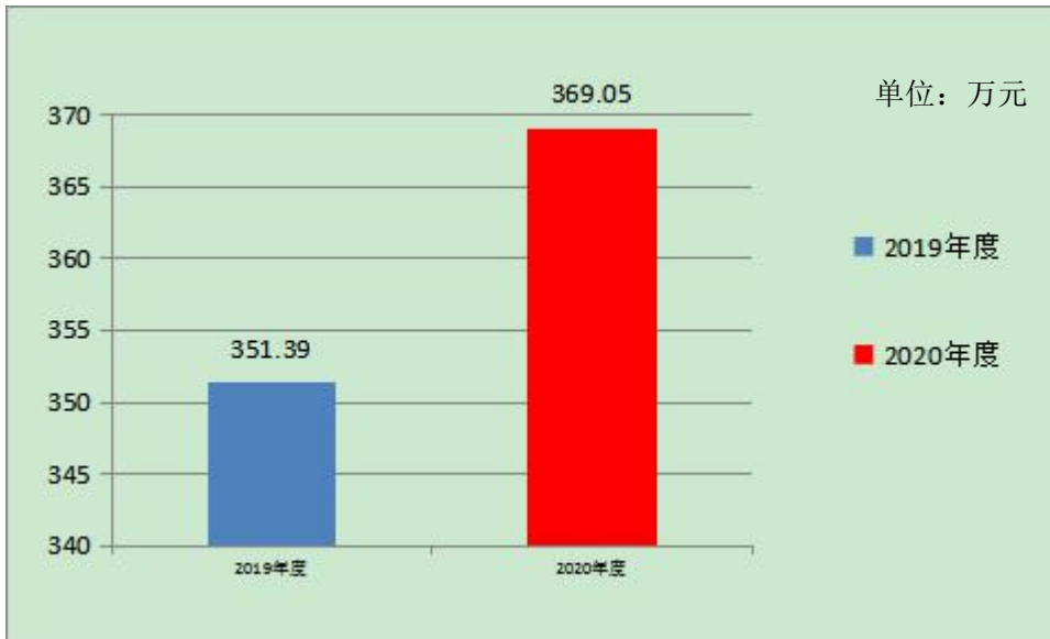
图 5：一般公共预算财政拨款支出决算变动情况