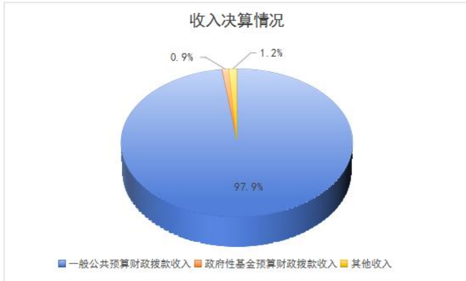
图2：收入决算结构图