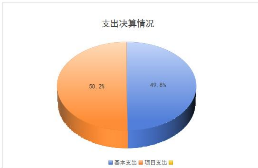
图3：支出决算结构图

2023年度本年支出合计1,206.98万元，其中：基本支出601.26万元，占49.8%；项目支出605.72万元，占50.2%。