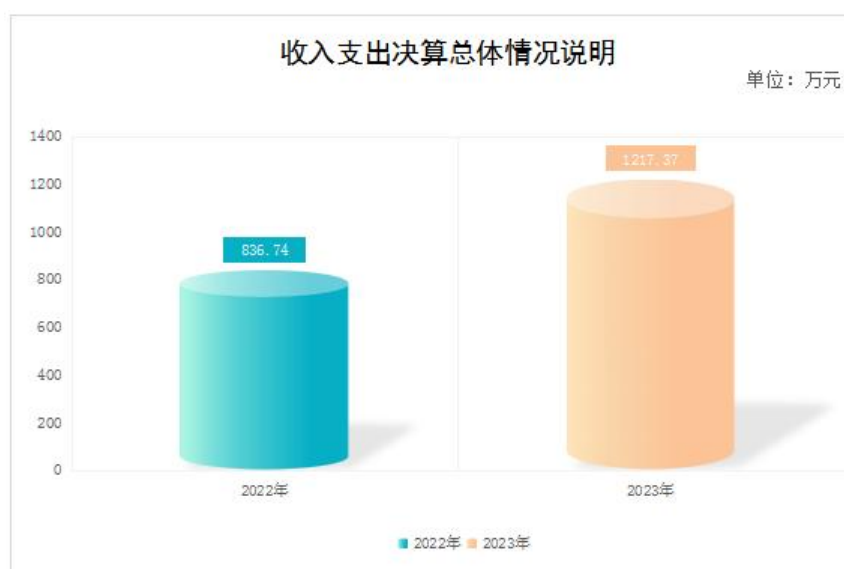
图1：收、支决算总计变动情况图

2023年度收、支总计均为1,217.37万元。与2022年度相比，收、支总计各增加380.63万元，增长45.5%。主要变动原因是人员经费增加以及常年性项目预算规模、支出结构调整等项目增加。