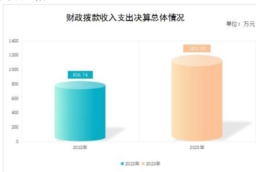
图4：财政拨款收、支决算总计变动情况

2023年度财政拨款收、支总计均为1,202.93万元。与2022年度相比，财政拨款收、支总计各增加366.19万元，增长43.8%。主要变动原因是人员经费增加以及常年性项目预算规模、支出结构调整等项目增加。