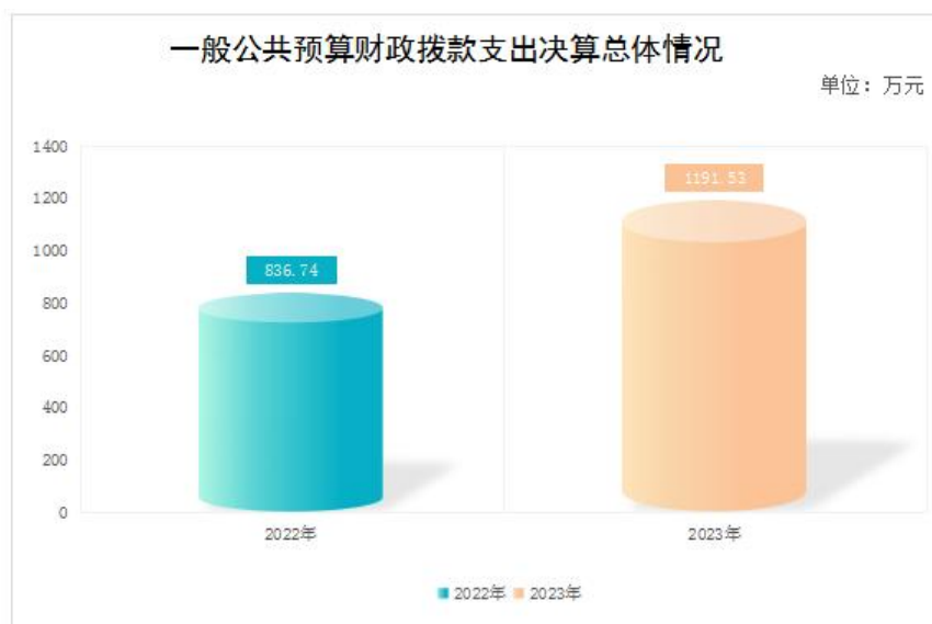
图5：一般公共预算财政拨款支出决算变动情况