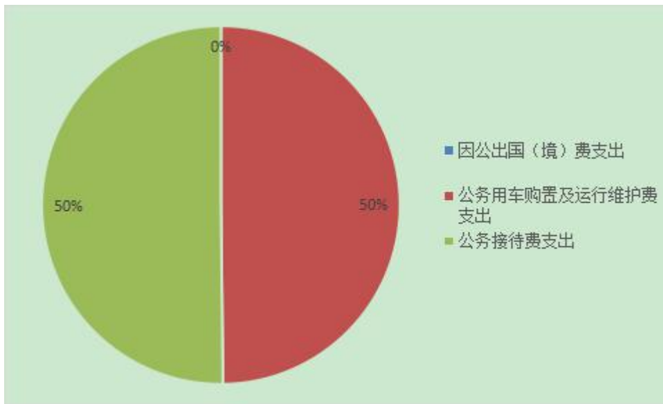
图 7：2020 年度“三公”经费财政拨款支出结构

(二)“三公”经费财政拨款支出决算具体情况说明。2020年“三公”经费财政拨款支出决算中，因公出国（境）费支出决算0万元，占0%；公务用车购置及运行维护费支出决算5.77万元，占49.8%；公务接待费支出决算5.81万元，占50.2%。具体情况如下：