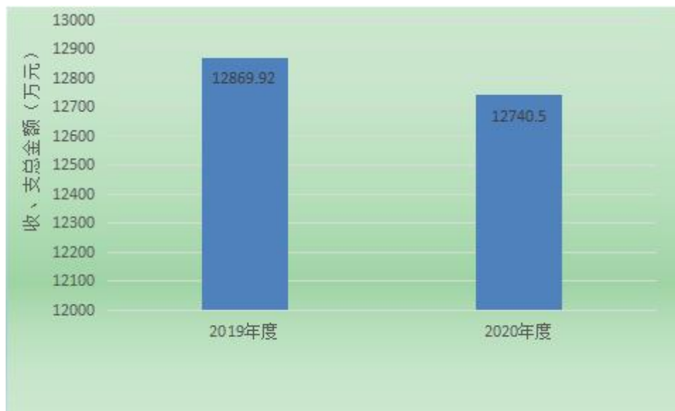
图 1：收、支决算总金额变动情况图（单位：万元）

2020 年度收、支总计 12740.51 万元。与 2019 年相比，收、支总计各减少 129.42 万元，下降 1%。主要变动原因是项目支出较去年减少。