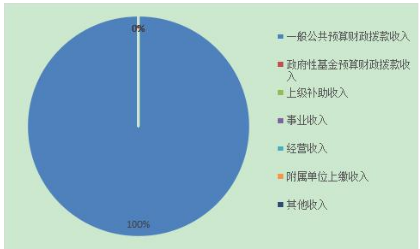
图 2：2020 年收入决算结构图