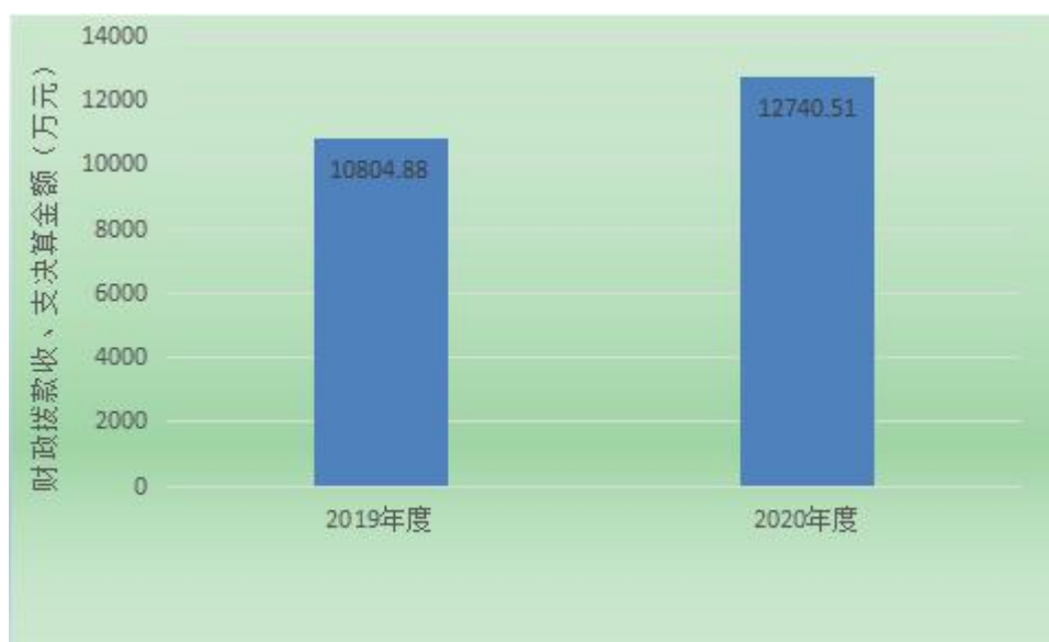
图4：财政拨款收、支决算总计变动情况（单位：万元）

2020年财政拨款收、支总计12740.51万元。与2019年相比，财政拨款收、支总计各增加1935.63万元，增长17.9%。主要变动原因是当年财政拨款项目较上年增多。