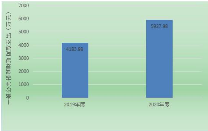
图 5：一般公共预算财政拨款支出决算变动情况（单位：万元）